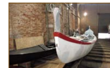
Trup válečné lodi čeká na sochařskou výzdobu v benátském přístavišti Arsenale.