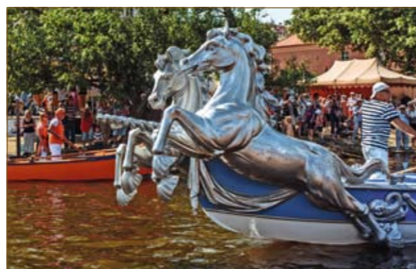
Benátské lodě bissone při slavnostech NAVALIS v Praze v květnu 2018.