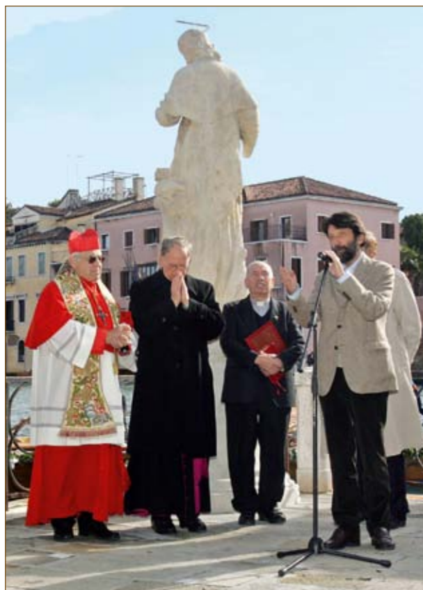
V roce 2009 sochu sv. Jana Nepomuckého na břehu Canal Grande požehnal kardinál Miloslav Vlk.

Bissona Praga je dlouhodobý mnohgenerační projekt, který bude „fungovat“ i v daleké budoucnosti. Životnost této lodě bude obrovská, jelikož bude uchovávána na suchu, v hale benátské loděnice Arsenale. Kromě cest do Prahy bude dok opouštět pravděpodobně jen na Regatu Storicu.