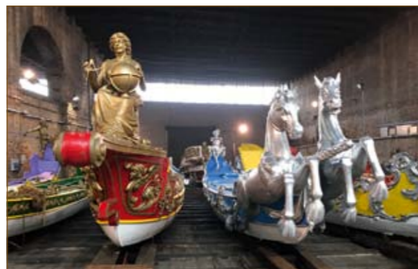
Lodě v hale benátské loděnice Arsenale.