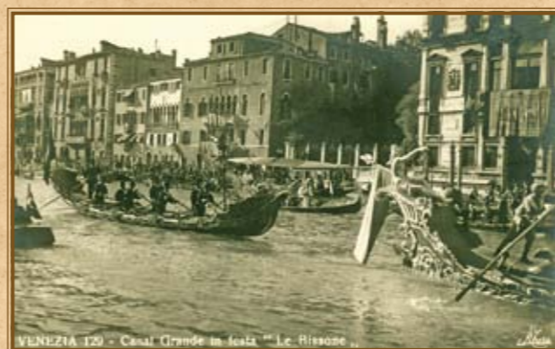
Bissony při vodní slavnosti Regata Storica na Canal Grande.

Historická regata – Regata Storica je jedna z nejdůležitějších a nejstarších benátských slavností organizovaná tamní radnicí. Její historie sahá do poloviny 13. století. Po téměř sedm století se každým rokem Benátčané scházejí, aby změřili při závodu lodí síly se svými sousedy i přespolními veslaři. Na regatu se sjíždějí desetitisíce návštěvníků z celého světa. Akce je veřejná a má nekomerční charakter.