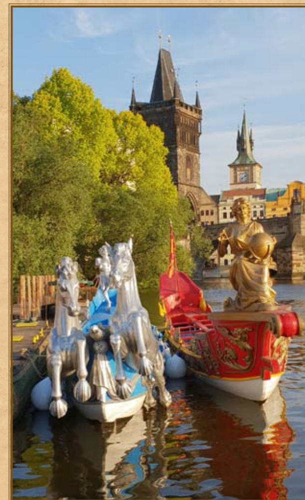
Benátské lodě Cavalli a Geographia v roce 2018 na pražských slavnostech NAVALIS.

Jako jediným se nám podařilo v roce 2018 dostat za hranice domovského města Benátek dvě lodě typu bissona (Geographia, Cavalli), ty se staly hlavní ozdobou programu desátého jubilejního ročníku Svatojánských slavností NAVALIS 2018. Lodě po dobu slavností přitahovaly pozornost široké veřejnosti, odborníků i médií. Bissona Praga po svém uvedení v Benátkách v září 2019 bude nedílnou součástí Svatojánských slavností NAVALIS 2020.