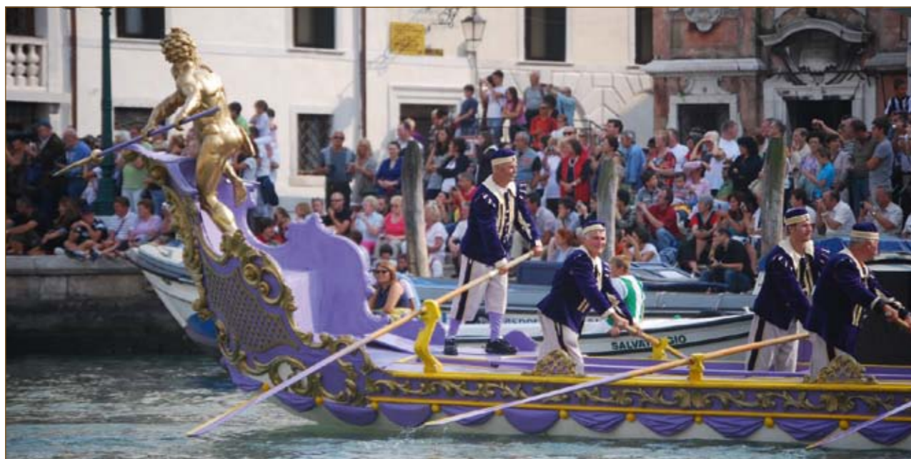
Desítky tisíc lidí obdivují každým rokem při benátské regatě starobylé lodě i umění veslařů.