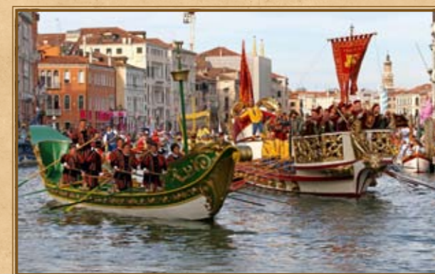
Přehlídka Regata Storica je velkolepou podívanou dodnes.