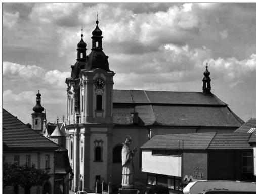
kostel sv. Jana Nepomuckého v Nepomuku