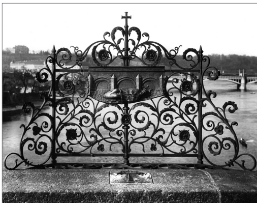
místo svržení světcova těla z Karlova mostu do Vltavy v Praze 20. března 1393